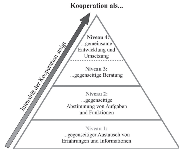
Abbildung 1 (vgl. Spies/Pötter 2011, 32 2 )

Unterscheidet man die Kooperationsverhältnisse je nach ihrer Ausgestaltung in vier unterschiedliche Kooperationsniveaus 1 (siehe Abbildung 1), dann etabliert sich mit den Delmenhorster Präventionsbausteinen eine kommunal abgestimmte Zusammenarbeit unterschiedlicher Handlungsfelder der Sozialen Arbeit untereinander und mit Institutionen des Bildungswesens, die vom Kooperationsniveau der zweiten Stufe (gegenseitige Abstimmung von Aufgaben und Funktionen) über die dritte (gegenseitige Beratung) bis hinein in die vierte Niveaustufe der gemeinsamen Konzeption und Umsetzung reicht – und die hierfür nötige Intensität der Zusammenarbeit offenbar auch zu tragen