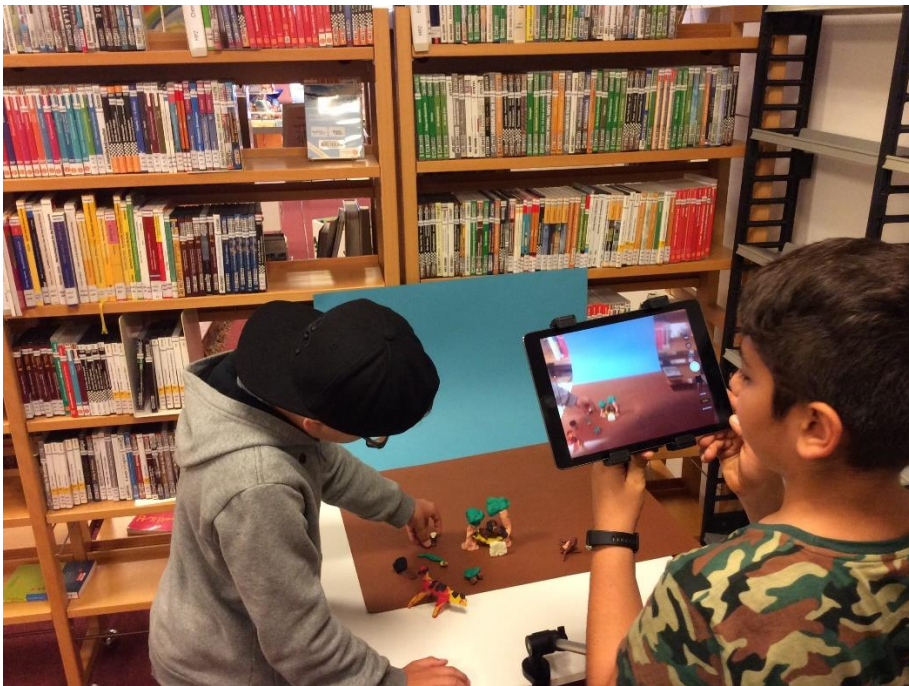
Trickfilmwerkstatt des MPZ für die Teilnehmer des JULIUS Clubs.