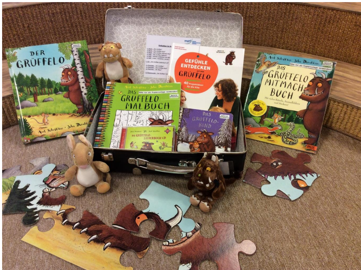
Erzählkoffer „Der Grüffelo“ zum Verleih in Kindertagesstätten.

inhaltliche Gestaltung der Erzählkoffer fand in enger Abstimmung zwischen Stadtbücherei und MPZ statt.