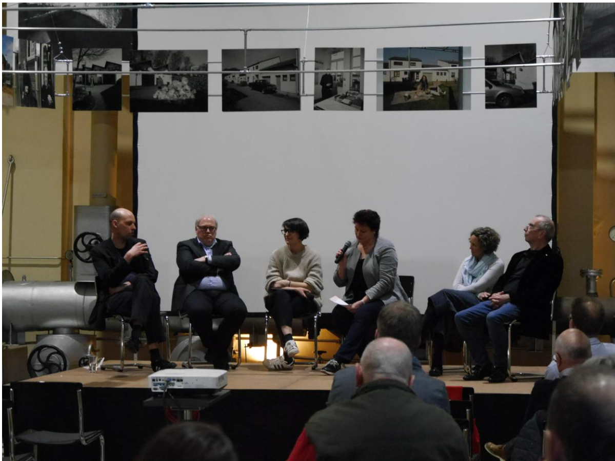
Podiumsdiskussion während des Symposiums des Beirates des Museums am 18. März 2022

Im Zusammenhang der neugestalteten Abteilung Vom Vlies zum Garn im Fabrikmuseum, sind, auf der Grundlage von Erkenntnissen der Medizinhistorikerin Ulrike Wendt, durch das Museum nach langen Recherchen neue Erkenntnisse zum Thema Milzbrandgefährdung in die aktuelle Dauerausstellung integriert worden.