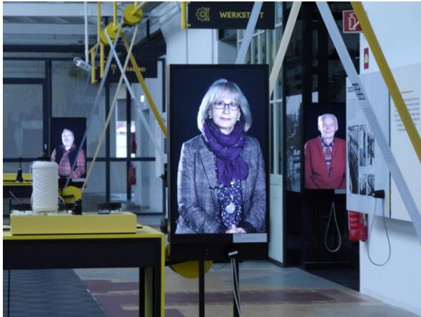
Blick in die neue Dauerausstellung

Am Tag der Eröffnungsveranstaltung fand ebenfalls ein Festakt statt, mit dem das 25jährige Bestehen des Förderkreises des Museums gewürdigt wurde.