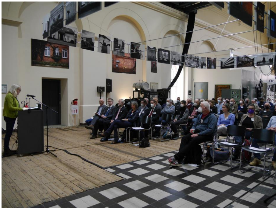
Eröffnung der Niedersächsischen Archivtage am 25. April

Zu den in der Turbinenhalle durchgeführten Sitzungen gehörten eine des Ausschusses 4 K, eine Tagung der Archäologischen AG der Oldenburgischen Landschaft, eine Sitzung des Beirates der Oldenburgischen Landschaft und die von unserem Stadtarchiv initiierte und weitgehend vom Museum betreute niedersächs. Archivtagung.