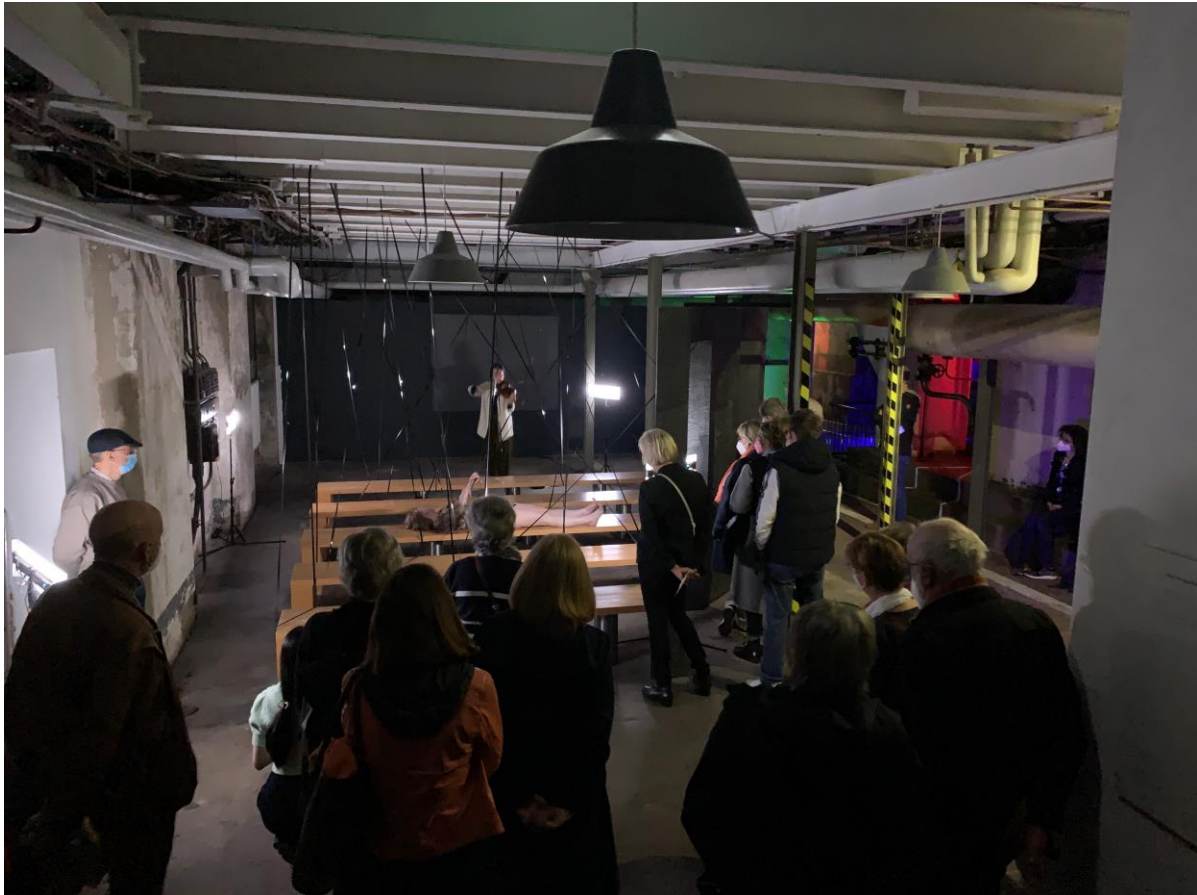
Auftritt des Ensembles Filidonia im Fabrikmuseum

statt. Der Abend, an dem sie von Nico A. Stabel (Klavier) begleitet wurde, stand unter dem Motto Von Musik liebevoll eingehüllte Texte . Das Gitarrenensemble Quartet ± der Musikschule Delmenhorst ist am 7. Oktober in der Turbinenhalle aufgetreten. Am 8. Dezember war zum insgesamt dritten Mal der Schauspieler und Moderator Dirk Böhling mit einem Weihnachtsprogramm in der Turbinenhalle zu sehen.